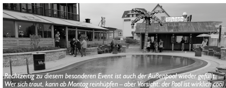
Rechtzeitig zu diesem besonderen Event ist auch der Außenpool wieder gefüllt. Wer sich traut, kann ab Montag reinhüpfen – aber Vorsicht: der Pool ist wirklich cool.